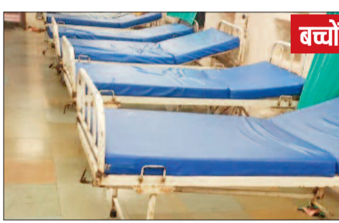
बच्चों को जोखिम ज्यादा

आंबेडकर और जिला अस्पताल में गर्मी से बीमार होने वाले मरीजों के लिए पृथक से लू वार्ड बनाया गया है, मगर अभी इसकी जरूरत मरीजों को भर्ती करने के लिए नहीं पड़ी है। हालांकि दोनों अस्पतालों के मेडिसिन विभाग में आने वाले दस फीसदी मरीज मौसम से पीड़ित हैं। पिछले सप्ताहभर से गर्मी ने अपना रंग दिखाया है और राजधानी समेत कई शहरों को लू का प्रकोप है। दोपहर आग उगलती गर्मी में बिना सुरक्षा के घूमने वाले लोग हीट-स्ट्रोक का शिकार हो रहे हैं। लू लगने की वजह से विभिन्न आर्गन कमजोर होने, बुखार आने, उल्टी, लूज मोशन, बीपी की समस्या हो रही है। अपने स्तर पर ठीक नहीं होने पर मरीज इलाज के लिए अस्पताल पहुंच रहे हैं। चिकित्सकों का कहना है कि गर्मी से पीड़ित मरीजों की संख्या घटने में नहीं हुई है मगर उनके अस्पताल पहुंचने का दौर जारी है। नियमित ओपीडी में गर्मी की बीमारी से पीड़ित दर्जनभर मरीजों के आने का सिलसिला चल रहा है।