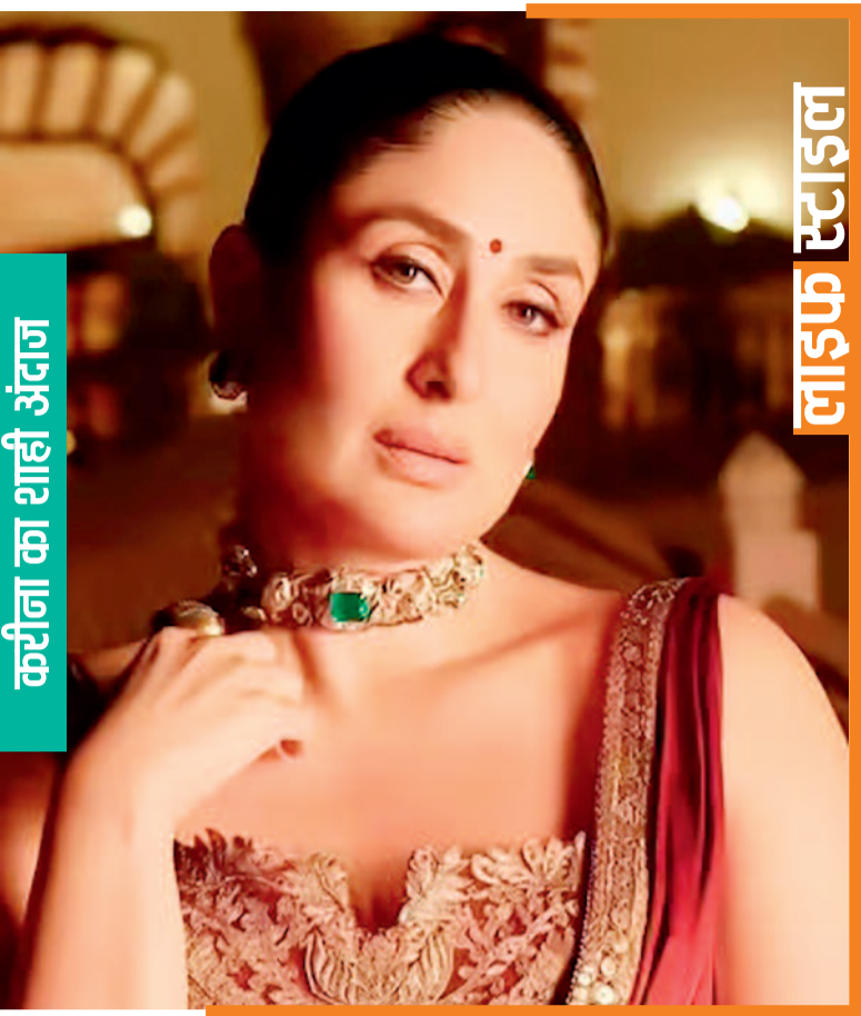
करिना का शाही अंदाज

करिना कपूर ने एक बार फिर साबित कर दिया कि स्टाइल के मामले में उनका मुकाबला करना आसान नहीं है। एक ज्वेलरी इवेंट में उनका ट्रेडिशनल और मॉडर्न का मेल हर किसी का ध्यान खींचा। यह लुक सादगी, शाहीपन और व्लास का खूबसूरत मिश्रण था, जिसमें हर डिटेल खास नजर आ रही थी। उन्होंने फिलोरी कुर्ता सेट पहना। गहरे नीले रंग का अज्रख प्रिंट था। नीचे की ओर उन्होंने साधारण पैंट्स की जगह डिजाइनदार सलवार पहनी, जिसमें स्ट्राइप्स और कढ़ाई का सुंदर मेल था। इसने पूरे लुक को हल्का विटेज और शाही एहसास दिया।