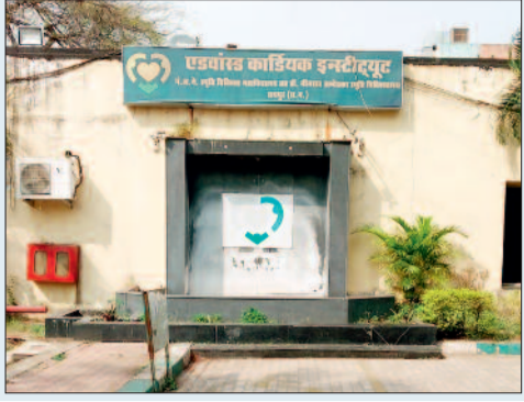
एडवांस कार्डियक इंस्टीट्यूट का बाहरी दृश्य।

हृदय संबंधी रोगियों की बढ़ती संख्या और शासकीय सेक्टर में एकमात्र संस्थान होने की वजह से यहां के कार्डियोलॉजी और कार्डियक सर्जरी विभाग में बड़ी संख्या में मरीज पहुंचते हैं। मरीजों की आवश्यकता को देखते हुए एडवांस कार्डियक इंस्टीट्यूट को तमाम संसाधनों से लैस किए जाने की जरूरत है। उपकरणों के साथ यहां वार्डों के साथ पर्याप्त मानव संसाधन की व्यवस्था करना आवश्यक है। राज्य शासन द्वारा इस बजट में एसीआई के आधुनिकीकरण के लिए 10 करोड़ का बजट स्वीकृत किया है।